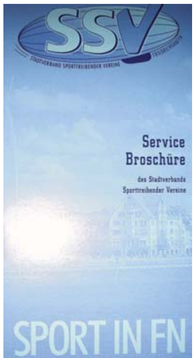
SPORT IN FN